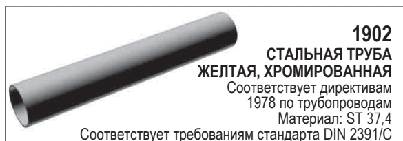
1902 СТАЛЬНАЯ ТРУБА ЖЕЛТАЯ, ХРОМИРОВАННАЯ Соответствует директивам 1978 по трубопроводам Материал: ST 37.4 Соответствует требованиям стандарта DIN 2391/C